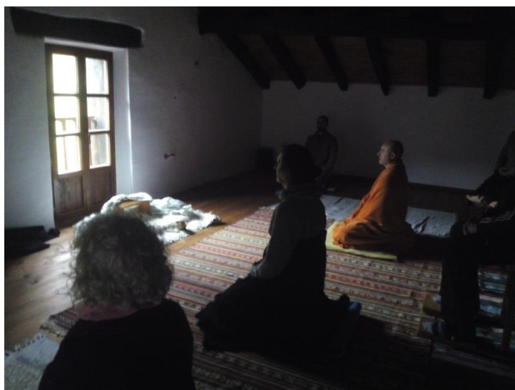
Beintzako, etxeko eta jardueraren irudiak